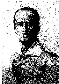
GRAN CRUZ LAUREADA DE SAN FERNANDO